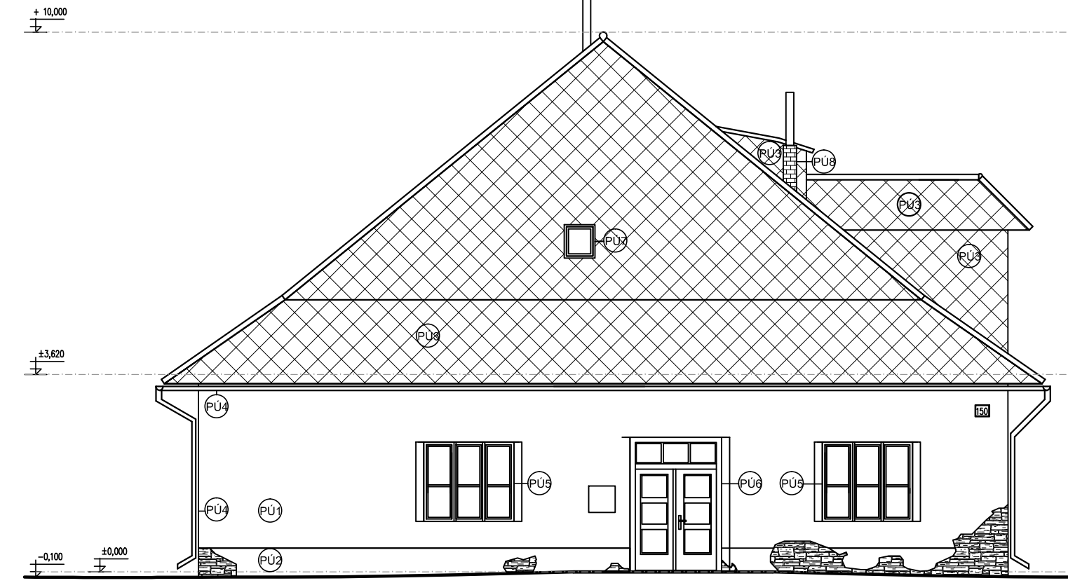
POHLAD JUHOVYCHODNY M 1:100